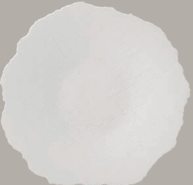
21141247 Prato Fundo Deep Plate Prato Hondo Assiette Creuse △ 540 gr A 69 mm Ø 270 mm △ 1 1/5 lbs H 2 5/7" Ø 10 5/8"