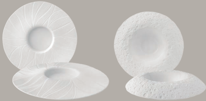
21141260 Prato Degustação Tasting Plate Plato Degustación Assiette Dégustation △ 775 gr A 30 mm Ø 328 mm △ 1 5/7 lbs H 1 1/6" Ø 13"