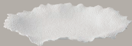
21141248 Travessa Platter Fuente Plate à Servir △ 1677 gr A 31 mm C 454 mm L 342 mm △ 3 2/3 lbs H 1 2/9" L 17 7/8" W 13 1/2"