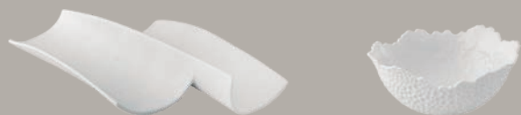
21141253 Taça L Bowl L Bol L △ 355 gr A 38 mm C 272 mm L 172 mm △ 7/8 lbs H 1 1/2" L 10 5/7" W 6 7/8"