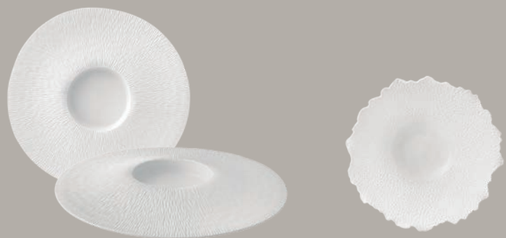
21141251 Prato Degustação Tasting Plate Plato Degustación Assiette Dégustation △ 860 gr A 30 mm Ø 325 mm △ 1 8/9 lbs H 1 1/6" Ø 12 4/5"