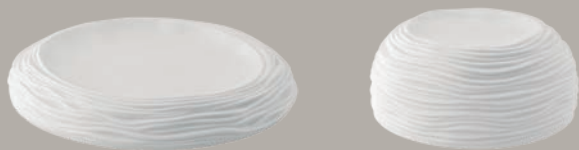
21141244 Taça M Bowl M Bol M △ 365 gr A 34 mm Ø 168 mm △ 4/5 lbs H 1 1/3" Ø 6 3/5"