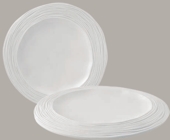
21141245 Prato Jantar Dinner Plate Plato Llano Assiette Plate △ 810 gr A 30 mm Ø 274 mm △ 1 4/5 lbs H 1 1/6" Ø 10 4/5"