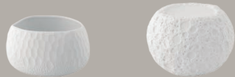
21141261 Taça M Bowl M Bol M △ 300 gr A 80 mm Ø 131 mm △ 2/3 lbs H 3 1/7" Ø 6 1/6"