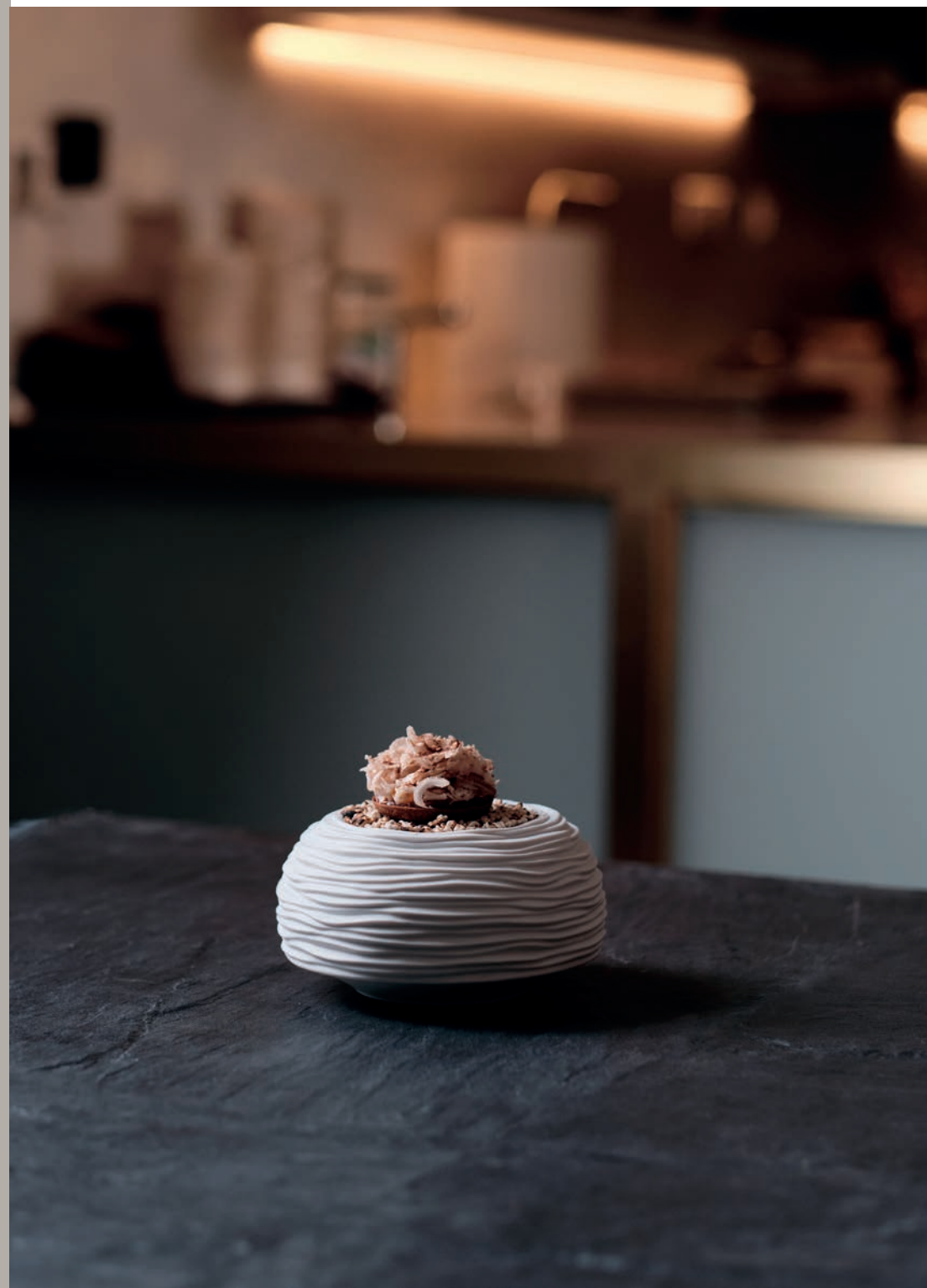
21141243 Taça S Bowl S Bol S △ 410 gr A 78 mm Ø 152 mm △ 1 lbs H 3" Ø 6"